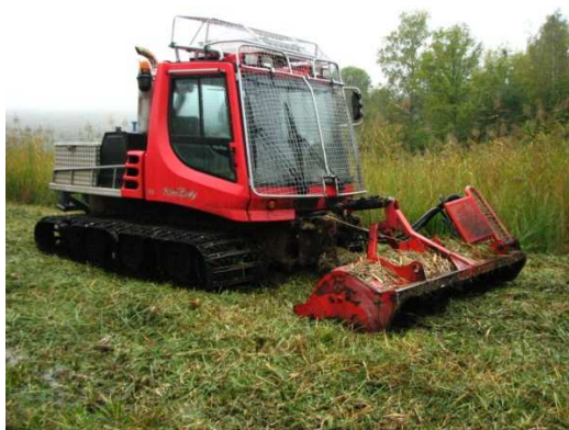
Broyeur sur chenillette

Pour plus d'informations, contacter le gestionnaire de la Réserve naturelle au 04.76.65.08.65.