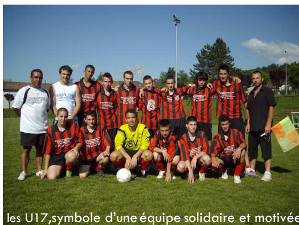
les U17, symbole d'une équipe solidaire et motivée

En Seniors, une équipe réserve à la demande de quelques joueurs va être mise en place tandis que l'équipe fanion va tenter de jouer pour cette année encore les premiers rôles en championnat.