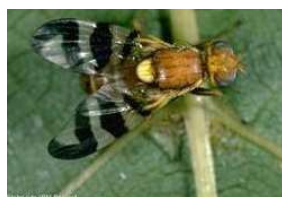
La mouche du brou

Communiqué de la Préfecture de la région Rhone-Alpes Direction Régionale de l'Agriculture et de la Forêt